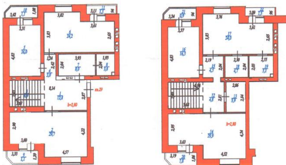
Квартира № 29