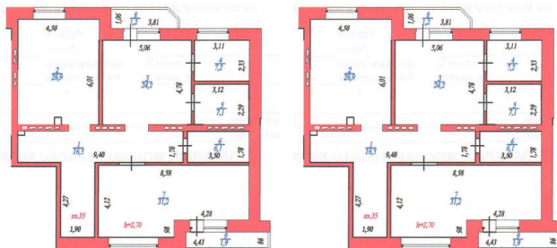
Квартира № 35