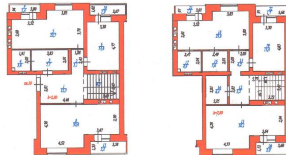
Квартира № 30